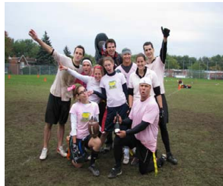
L'équipe gagnante au Tournoi de Flagfootball : Les Legally Blondes

Cette année, le CASS innove en présentant, le dimanche, 30 mai 2010 à 13 h, un tournoi de poker au profit d'Opération Enfant-Soleil lors duquel 100 joueurs auront l'occasion d'essayer leur sens du bluff.