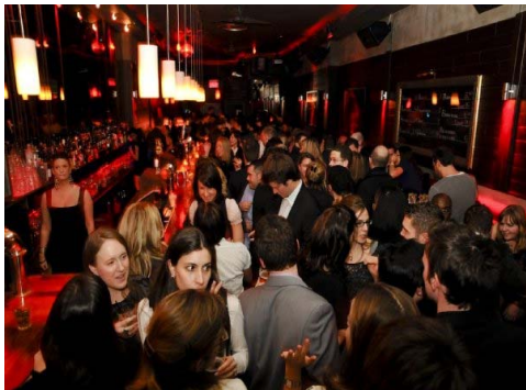
La Porte Rouge était à pleine capacité lors du 6@8 de début d'année

Tenu à la Cour d'appel, le 21 octobre 2009 sous la présidence du juge en chef du Québec, le Cocktail avec la magistrature a été une véritable réussite cette année avec ses 138 participants incluant 60 membres de la magistrature. Plus de 125 personnes sont venues y boire un verre. Le CASS en a d'ailleurs profité pour recueillir des dons pour les sinistrés d'Haiti.