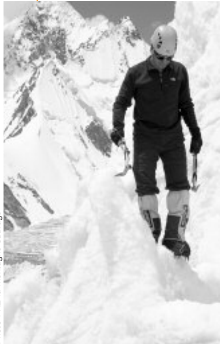
Photo : K2 la montagne sauvage

Il est étonnant de constater à quel point Montréal est l'hôte de plusieurs festivals du septième art, dont le Festival du nouveau cinéma de Montréal. On y présente du 7 au 18 octobre 2009 un contenu dicté par les nouvelles tendances en cinéma et en création nouveaux médias.