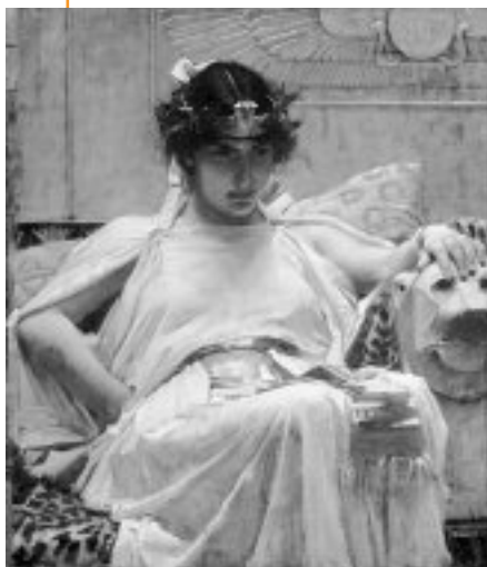
John William Waterhouse Rome 1849 - Londres 1917 Clytemnestre 1888 Huile sur toile Collection particulière, avec l'aimable concours de Christie's

Par ailleurs, du 1 er octobre au 7 février, le MBAM reçoit J. W. Waterhouse. Le jardin des sortilèges , la première rétrospective majeure des œuvres de l'artiste britannique John William Waterhouse (1849-1917), peintre néoclassique par la technique et la facture de ses œuvres, mais préraphaélite par le style et les thèmes abordés.